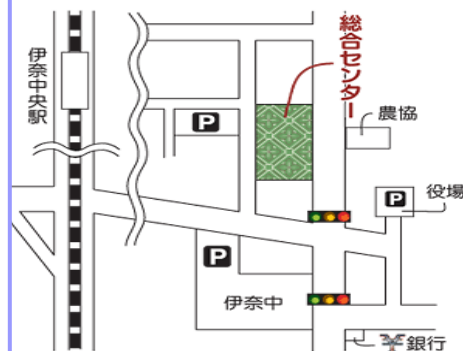
伊奈町総合センター 住所：伊奈町小室5161