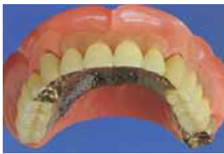
その上に入れ歯をはめ込む形になります