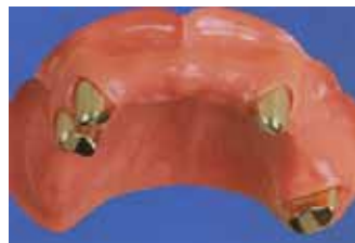
歯に金属の冠を被せます