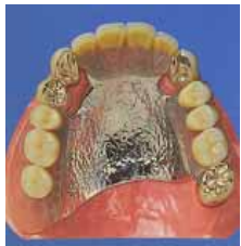
お口にセットしたところ