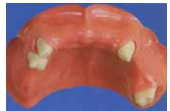
残っている歯（この場合は4本）を削ります