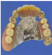
上顎の部分は金属で作ります